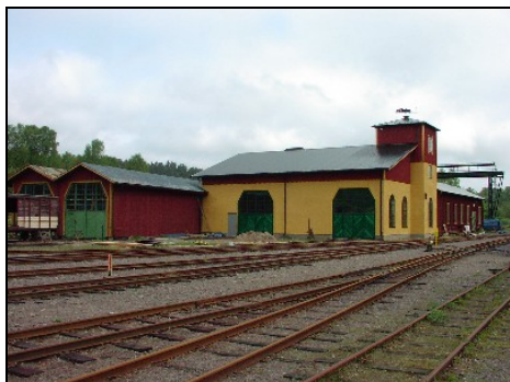
AGJ verkstad sommaren 2004

Utbyggnaden av järnvägens verkstad påbörjades för några år sedan. Under 2002/2003 uppfördes stommen till såväl den nya maskinverkstaden som smedja- och svarvrum. Arbetena har därefter fortsatt med inredningsarbeten och i dagsläget börjar byggnaden allt mer att närma sig ett färdigställande. Vissa arbeten återstår dock.