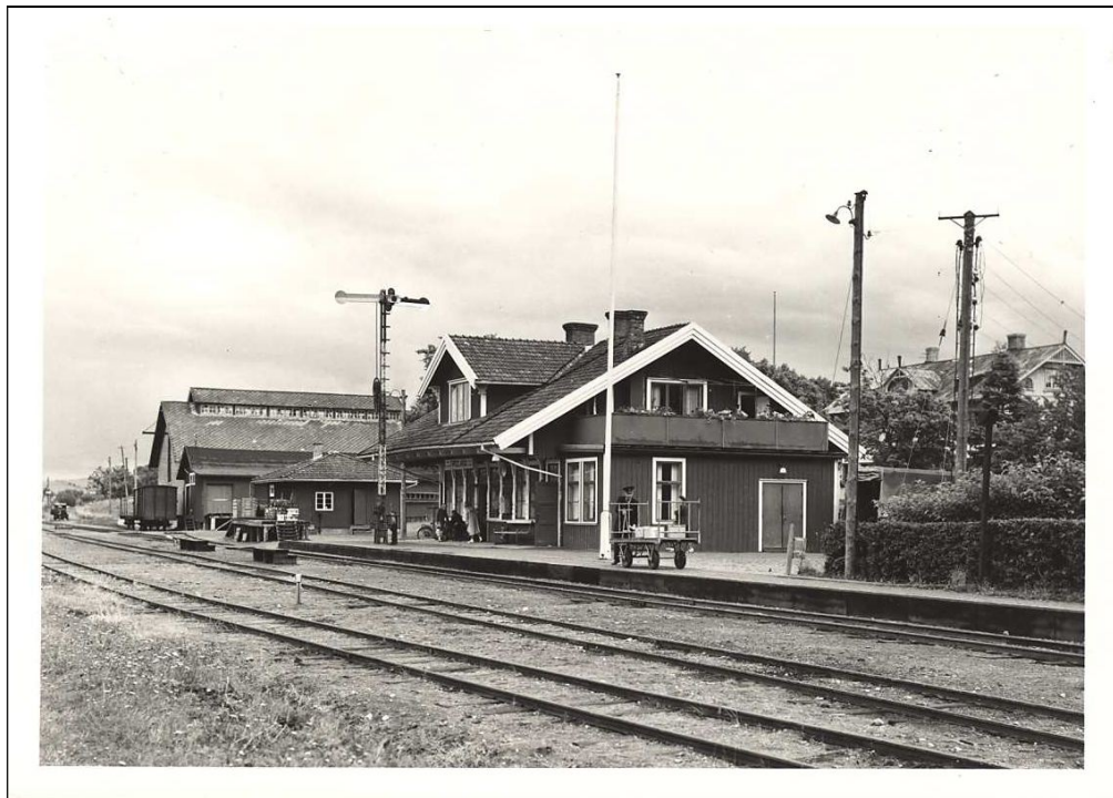
Detta foto från Bengtsfors station på den smalspåriga Lelängenbanan ger en god bild över vad järnvägen innebar för den bygd den genomkorsade. Här finns bl a den stora lagerbyggnaden för lantbruksprodukter, telestationens kopplingsstolpar och på plattformen inväntar man tåget från storstaden Uddevalla som har med sig bl.a. nyheter från omvärlden.

Under en lång följd av år var järnvägarna med sina ångtåg något av en pulsåder i många bygder. Om man skulle ut i stora världen började resa vid den lokala järnvägsstationen, där man köpte biljetten i stationshuset. Väntade man besök så fick man likaså åka till stationen för att möta vid tåget.