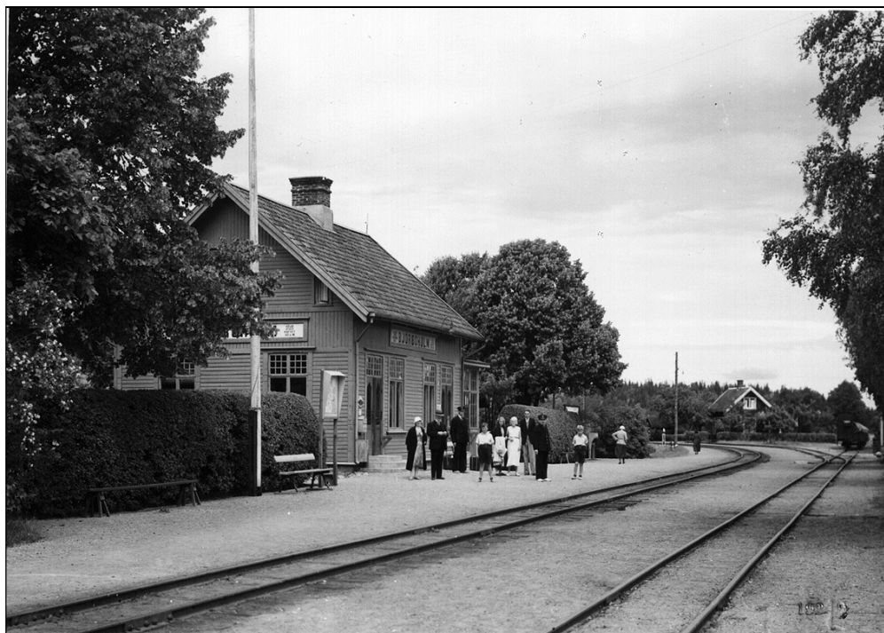
Resenärer och ortsbefolkning i väntan på tåg vid Björboholms station. Med några tiotal år på nacken har stationen hunnit etablera sig med en omgivande lummig trädgård.

Sedan i mitten av 1800-talet har utvecklingen i samhället gått oerhört snabbt. Mycket av det som i dagens samhälle upplevs som något helt naturligt, kunde våra förfäder inte ens drömma om. För att ge perspektiv åt tillvaron och även för att bereda framtida generationer möjlighet att förstå hur det moderna samhället vuxit fram, är det viktigt att representativa delar av gårdagens teknik bevaras och åskådliggörs i sitt rätta sammanhang.