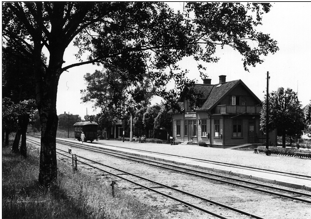
Olofstorps station på 1930-talet.

Vid VGJ låg i de flesta fall godsmagasinet norr om stationshuset, medan uthuset låg söder om med gaveln mot banan.